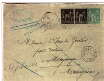
Tarif unique U.P.U. du 1.10.1881 - Décret du 7.09.1881 pour les bureaux et colonies françaises, soit 25 c. pour la lettre 1 er échelon de poids de 0 à 15 g. Lettre ré-expédiée à l'étranger avec la grille - retour à l'envoyeur