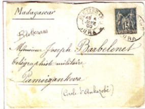
Tarif du 1.01.1899, loi du 8.04.1898 et décret du 26.12.1898 pour les lettres ordinaires dressées à des militaires français stationnés aux colonies et protectorats français, soumises au tarif intérieur français, soit 15 c.

Protectorat français en 1885 - En 1895-96, l'expédition Duchesse aboutit à la déchéance de la Reine Ranavalona III et à l'annexion de l'Ile par la France qui abolit l'esclavage. De 1896 à 1905 Gallieni travaille à la pacification et crée la Reine.