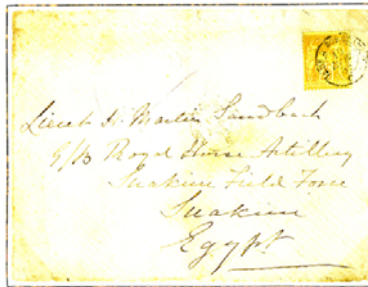
Tarif unique U.P.U. du 1.10.1881, décret du 7.09.1881, abandon de toutes les surtaxes maritimes soit 25 c. pour la lettre 1 er échelon de poids.

Les rares lettres au départ de France et affranchies avec un timbre au type Sage, pour les soldats en opérations à Suakim sont connues à travers l'Office Postal civil égyptien entre le 9 février et le 21 mars 1885. L'expédition britannique de Suakim, à l'est du Soudan égyptien au bord de la mer Rouge, a eu deux objectifs militaires : le premier a été de sécuriser le port de Suakim et le second a été la construction d'un chemin de fer de Suakim à Berber, villes distantes d'environ 360 kms. Suite à l'accord du 20 février 1885, un détachement du corps de l'Office Postal britannique a été envoyé pour servir l'expédition militaire. Un autre office postal a été ouvert à l'île Quarantine, quartier général de l'état major de Suakim. Fin mai, le corps expéditionnaire britannique retourne au delta après avoir démantelé la ligne de chemin de fer.