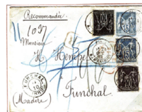
Tarif du 01.04.1879, décret du 27.03.1879 - 1 er échelon de poids 0 à 15 g = 25 c. + taxe de recommandé de 25c., tarif du 16.01.1879, loi du 26.12.1878 et décret du 3.01.1879