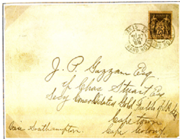
Tarif unique U.P.U. du 01.10.1881 : décret du 07.09.1881 (abandon de toutes les surtaxes maritimes) 1 er échelon de poids, 0 à 15 g = 25 c. Voie de Southampton - Timbre à date, type A