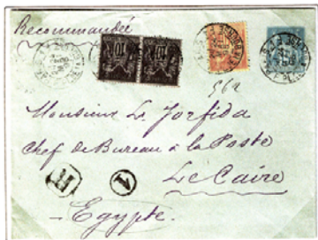
Tarif du 1 er 05.1878 : décret du 16.04.1878, 2 ème échelon de poids = 50 c. + taxe de recommandé de 25 c. tarif du 16.01.1879 : Loi du 26.12.1878 - Timbre à date type A