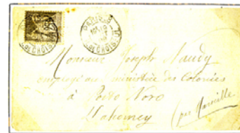
1 er échelon de poids = 25 c. Voie de Marseille - Timbre à date, type A

Tarif unique U.P.U. du 01.10.1881, décret du 7.09.1881 : abandon de toutes les surtaxes maritimes