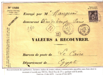
Recommander des quittances, factures, traites de toutes valeurs commerciales payables sans frais dont le montant n'excède pas 500 fr. Droit fixe de 25 c. quelque soit le poids. Tarif du 15.06.1879 - Loi du 07.04.1879