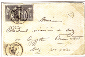
1 er échelon de poids, 0 à 15 g = 30 c.