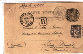
Tarif du 1.05.1878 pour la carte postale = 10c. + taxe de recommandé de 25c. tarif du 16.01.1879 Loi du 16.01.1879 et décret du 3.01.1879