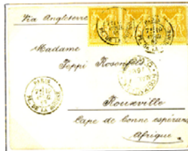
Tarif pré-U.P.U. du 01.05.1878, 1 er échelon de poids = 75 c. Voie d'Angleterre - Timbre à date type 18

LE CAP DE BONNE ESPERANCE : Entrée U.P.U. le 01.02.1895