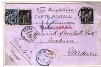
Tarif du 01.04.1879, décret du 27.03.1879 de la carte postale = 10 c. + taxe de recommandation de 25 c., tarif du 16.01.1879, loi du 26.12.1878 et décret du 3.01.1879 Voie d'Angleterre