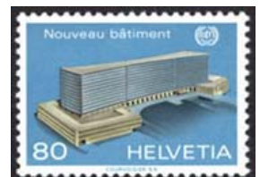
Timbre-poste de service émis pour le BIT en 1975.

L'OIT joue un rôle majeur dans l'établissement d'un système complet de normes internationales en faveur des peuples autochtones.