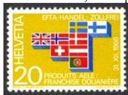
Timbre-poste émis en 1967.

Créée en 1960, elle a pour but d'éliminer les tarifs et autres restrictions commerciales parmi ses membres et se distingue des autres organisations par son caractère strictement économique. Aujourd'hui, l'AELE n'est formée que de 4 pays : la Norvège, l'Islande, le Liechtenstein et la Suisse qui ne sont pas candidats à l'UE. Pour les autres pays, c'est l'Union Européenne qui a pris le relais dans ce domaine économique.