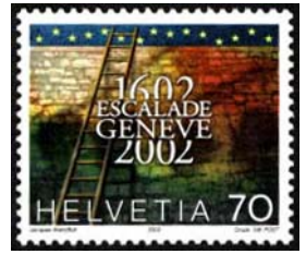
Timbre-poste émis en 2002 pour le 400 ème anniversaire.

Depuis lors, une cérémonie, l'Escalade, permet chaque année de commémorer cet événement et d'honorer ceux qui versèrent leur sang pour que Genève demeure à jamais une ville libre.