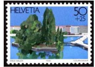
Timbre-poste tiré du bloc émis à l'occasion de l'exposition nationale de philatélie en 1990.

Le Pont des Bergues, ainsi nommé en hommage au philanthrope Jean Kleberger orthographié Clébergue, dont la construction a été achevée en 1834 relie les deux rives du Rhône.