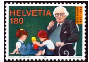
Timbre-poste émis en 1996 pour son centième anniversaire.

Psychologue, fondateur de l'épistémologie génétique, il a particulièrement étudié le développement de l'intelligence chez l'enfant. De formation de base en biologie, sa vocation de naturaliste se développe dès son plus jeune âge. Dans le même temps, il se préoccupe de philosophie, de métaphysique et même de théologie. Dès 1919, il part à Paris pour construire sa théorie du développement cognitif de l'enfant. De retour à Genève, il obtient un poste de chef des travaux auprès du psychologue E. Claparède. Par ses travaux, il renouvelle la conception de la pensée de l'enfant, qui est fondamentalement différente de l'adulte. Il sera reconnu comme le plus grand psychologue du XX ème siècle.