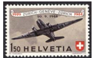
Timbre-poste aviation émis en 1944.

En 1944, l'on célèbre les 25 ans de poste aérienne en Suisse. A cette occasion, des vols spéciaux Zurich - Genève - Zurich sont organisés le 20 septembre 1944, vols transportant la correspondance affranchie au moyen du timbre de Fr. 1,50 dont la validité est limitée à ce jour-là.