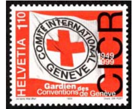
Timbre-poste émis en 1999 pour son 50 ème anniversaire.

Il ne faut pas oublier que le CICR est déjà très actif dans le domaine de la santé. Il s'emploie à rallier les Etats pour qu'ils fassent respecter le droit international humanitaire.