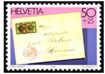
Timbre-poste tiré du bloc émis à l'occasion de l'exposition nationale de philatélie en 1990.

En 1993, pour le 150 ème anniversaire des timbres-poste suisses, le double-vert et le 4/6 de Zurich sont encore une fois réunis en un seul timbre.