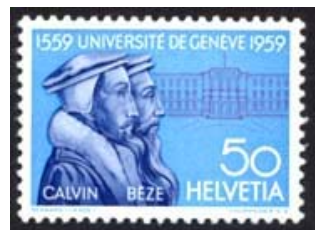
Timbre-poste émis en 1959 pour le 400 ème anniversaire de l'Université.

Réformateur religieux, homme politique et l'un des premiers grands écrivains de langue française, Jean Calvin a fait de Genève la capitale et le centre de diffusion principale du protestantisme. Il fonda en 1559 l'Académie protestante de Genève de renommée européenne, future université dont Théodore de Bèze (Vézelay 1519 - Genève 1605), écrivain et théologien protestant, deviendra le recteur.