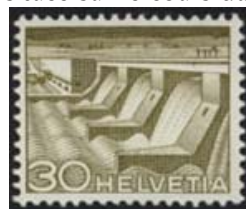
Timbre-poste émis en 1949.

Le plan d'eau formé par ce barrage est un refuge apprécié en hiver pour les oiseaux migrateurs. Les voies de migration des poissons sont assurées par une échelle à poissons qui permet de franchir la chute d'eau de 20 mètres.