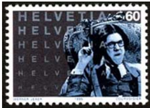
Timbre-poste émis en 1995 pour le centenaire du cinéma.

Acteur français, d'origine suisse, qui débuta au théâtre et triompha au cinéma. Il entra dans la troupe des Pitoëff en 1921 et joua chez Dullin à l'Atelier en 1925/1926.