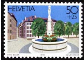
Timbre-poste tiré du bloc émis à l'occasion de l'exposition nationale de philatélie en 1990.

Ancien forum romain, situé hors des murs de la cité, le Bourg de Four se trouvait à la convergence des sentiers puis des routes romaines de la rive gauche du lac et de la vallée de l'Arve.