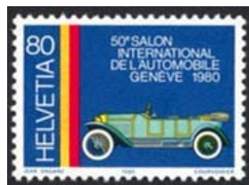
Timbre-poste émis en 1980 pour le 50 ème Salon.