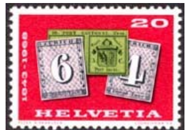
Timbre-poste émis en 1968 pour le 125 ème anniversaire des timbres-poste suisses.

En 1968, le double de Genève et les deux timbres de Zurich furent réunis sur une seule vignette pour célébrer leur 125ème anniversaire.