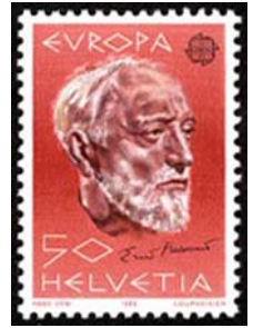
Timbre-poste émis en 1985

Professeur au collège de Lausanne, sa passion, la musique, l'emporte. Il est nommé titulaire de l'orchestre à Montreux en 1912. Il devient le chef d'orchestre des Ballets Russes avec lesquels il rencontre un grand succès de 1915 à 1923. En 1918, c'est la création du premier Orchestre de la Suisse Romande à Genève. De 1940 à 1969, Ansermet assure les tournées de l'O.S.R. de renommée mondiale à l'étranger tout en conduisant les concerts du Grand Théâtre à Genève. En 1954, il est reçu bourgeois d'honneur de Genève. Il publie, en 1961, un livre intitulé "Les fondements de la Musique dans la conscience humaine", qui relate une expérience musicale par l'homme.