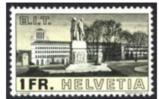
Timbres-poste émis en 1938

L'OIT joue un rôle majeur dans l'établissement d'un système complet de normes internationales en faveur des peuples autochtones.