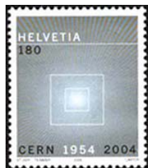
Timbre-poste émis en 2004 pour les 50 ans du CERN.

Cette Organisation assure la collaboration entre les Etats européens en matière de recherches nucléaires de caractère purement scientifique et fondamental. Elle encourage la coopération internationale dans la recherche, les contacts entre chercheurs et les échanges avec d'autres laboratoires et instituts.