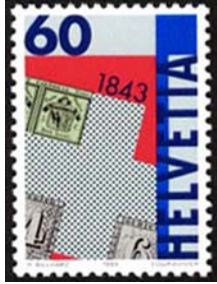
Timbre-poste émis en 1993 pour le 150 ème anniversaire des postes suisses.

47 ans après la première exposition nationale de philatélie qui avait été organisée à Genève à l'occasion du centenaire du timbre-poste en septembre 1943, la seconde exposition nationale s'est tenue au nouveau Palais des Expositions du 5 au 16 septembre 1990.