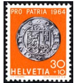
Timbre-poste Pro Patria émis en 1964 dans la série des anciennes monnaies suisses.

Des monnaies furent émises (principalement des sols, des florins et des écus) avec sa devise Post tenebras lux (Après les ténèbres la lumière) et les armes de la République.