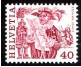
Timbre-poste émis en 1977 dans la série des costumes populaires.

Dans la nuit du 11 au 12 décembre 1602, la Cité faillit perdre le bénéfice d'une longue lutte pour la conquête de ses libertés.