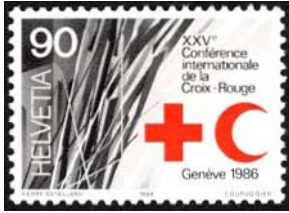
Timbre-poste émis en 1986 pour sa 25 ème conférence.

Cette conférence se réunit à Genève en présence des 194 Etats adhérents aux Conventions de Genève. Elle mobilise la communauté internationale autour des grands défis humanitaires tels que la protection et l'aide aux victimes de conflits armés, mais aspire aussi à faire œuvre utile dans les domaines de la migration internationale, de la violence dans les villes et de la dégradation de l'environnement.