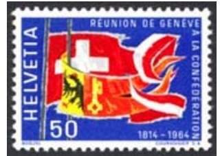
Timbre-poste émis en 1964 pour commémorer la décision de la réunion de Genève à la Confédération.

"Chaque année, le 31 décembre, dans la grisaille frileuse de l'aube, les Genevois se rassemblent à la Treille, sur les anciens remparts de la ville. Le son du canon leur rappelle quel durable bonheur ce fut pour eux d'avoir échappé à l'étreinte française et d'avoir pu six mois plus tard faire entrer au havre des libertés helvétiques la nacelle de leur indépendance, miraculeusement échappée aux naufrages de l'Histoire. C'est le 1er juin au Port noir qu'ils commémorent le débarquement des contingents fribourgeois et soleurois dont la présence symbolique attestait que désormais Genève était suisse." (Genève s'est retrouvée, d'Olivier Reverdin.)