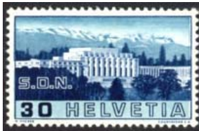
Timbres-poste émis en 1938

Suite au Traité de Versailles, en 1919, la ville de Genève, ville neutre, au centre de l'Europe, fut choisie, en association avec celui de la Croix Rouge internationale, pour héberger le siège de la Société des Nations (S.D.N.) au Palais Wilson. Cette organisation internationale a eu pour vocation universelle et permanente le maintien de la paix par la solution pacifique des conflits entre les peuples, la garantie contre l'agression et le développement des relations internationales. Les biens de cette Société furent transférés au siège des Nations Unies en 1936. Le Palais des Nations devint le siège européen de l'ONU en 1966.