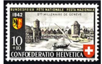
Timbre-poste Pro Patria émis en 1942 pour le 2 ème millénaire de Genève.

En dépit de la deuxième guerre mondiale, le deuxième millénaire de Genève a été célébré dignement en 1942.