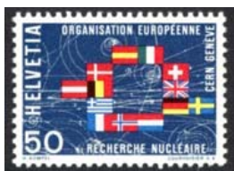
Timbre-poste émis en 1966.

C'est l'un des plus grands et plus prestigieux laboratoires scientifiques du monde. Il a pour vocation la physique fondamentale, la découverte des constituants et des lois de l'Univers.