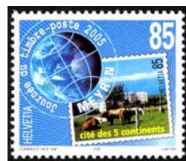
Timbre-poste émis en 2005 pour la Journée du Timbre.

Dès 1794, après la Révolution française, il n'y a pas de grand progrès dans le développement de la région. En mai 1815, la République de Genève devient Suisse. On lui adjoint par le 2 ème traité de Paris diverses communes dont celle de Meyrin pour former le Canton de Genève. Aujourd'hui, Meyrin, dynamique et prospère, est devenue une "cité des 5 continents" dont la diversité culturelle est remarquable.