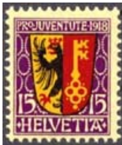
Timbre-poste Pro Juventute émis en 1918 dans la série des écussons des cantons.

En 1387, l'évêque Adhemar Fabri octroie à Genève une charte de franchises qui fut imprimée pour la première fois en 1507. Le frontispice de cette édition illustre l'origine des armoiries genevoises. Elles sont formées de la combinaison des armes de l'Empire (l'aigle à deux têtes) dont le prince évêque, seigneur de la ville, dépendait directement, et des armes de l'évêché (deux clefs croisées).