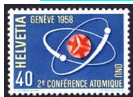
Timbre-poste émis en 1958.