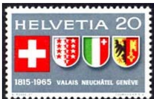
Timbre-poste émis en 1965 pour le 150 ème anniversaire de l'entrée de Genève dans la Confédération.