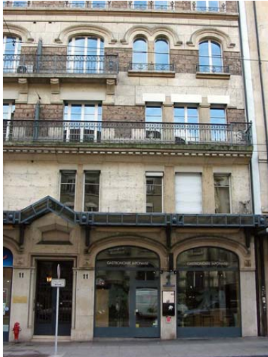
Vue de l'immeuble, où était située La Genevoise, tel qu'il est actuellement.