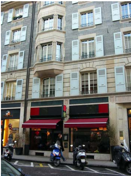
Vue de l'immeuble, où était située la Brasserie Moderne, tel qu'il est actuellement.

La première assemblée générale se tient à la Brasserie Moderne, rue du Vieux Collège.