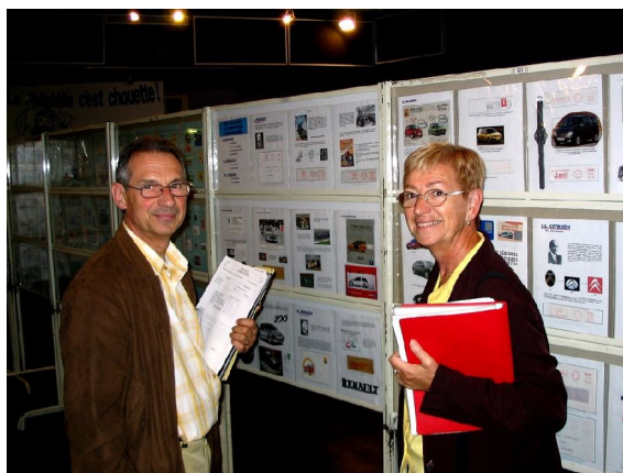
Les Jurés de la Classe Ouverte pendant leurs travaux.