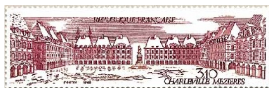
F - 1983