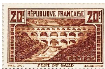
C - 1929