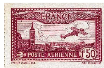
D - 1930