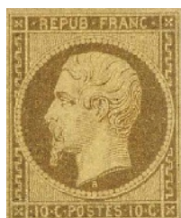
B - 1852