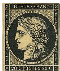
A - 1849

Trouvez le point commun de tous ces timbres, cela peut même vous donner une idée de collection !