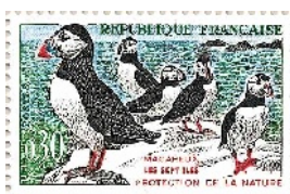
E - 1960