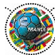
H - 1998